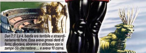
Dan 7:7 La 4. bestia era terribile e straordinariamente forte. Essa aveva grossi denti di ferro; divorava, sbranava e stritolava con le zampe ciò che restava... e aveva 10 corna.