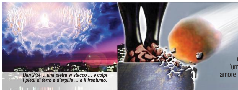
Dan 2:34 "...una pietra si staccò ... e colpì i piedi di ferro e d'argilla ... e li frantumò.

Le "corni simili a quelle di un agnello" che indicavano la gioventù e l'innocenza rappresentano appropriatamente il carattere originale degli USA. La libertà civile e religiosa (le due "corni"), furono gli elementi fondanti di questa nazione. I cristiani europei che erano perseguitati dal papato fuggirono a migliaia verso il "Nuovo Mondo": l'America. Questo fu la nascita degli USA. Ma la bestia