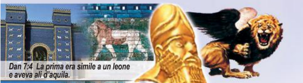
Dan 7:4 La prima era simile a un leone e aveva ali d'aquila.

A causa delle emigrazioni in massa (351 - 476 d. C.) l'impero Romano si divise in 10 regni europei più piccoli (Notate le 10 corna e le 10 dita dei piedi). I prosperosi corni separati e la non possibilità di fondersi insieme come la mescolanza del ferro con l'argilla delle 10 dita dei piedi rappresenta l'impossibile durata dell'Europa Unita.