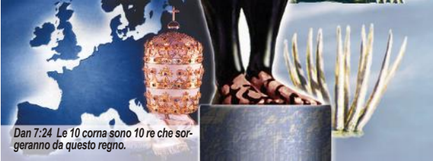
Dan 7:24 Le 10 corna sono 10 re che sorgeranno da questo regno.