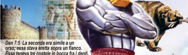
Dan 7:5 La seconda era simile a un orso; essa stava eretta sopra un fianco. Essa teneva tre costole in bocca fra i denti.