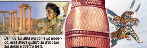
Dan 7:6 Un'altra era come un leopardo, essa aveva quattro ali d'uccello sul dorso e quattro teste.