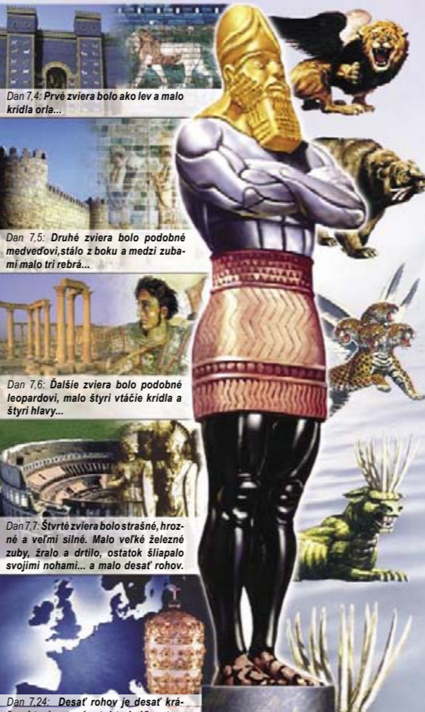
Dan 7,4: Prvé zviera bolo ako lev a malo krídla orla...

Rímska ríša sa rozpadla aj vplyvom sťahovania národov (351 - 476 n. l.) na desať európskych národov, neskôr štátov (pozri 10 rohov a desať prstov). Samostatne rastúce rohy a nesúdržnosť železa a hliny desiatich prstov znázorňujú, že zjednotenie Európy nemá trvácnosť.