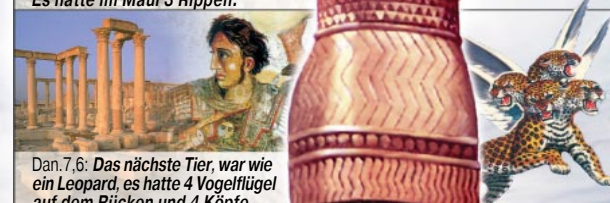
Dan. 7,6: Das nächste Tier, war wie ein Leopard, es hatte 4 Vogelflügel auf dem Rücken und 4 Köpfe.

Die enorm schnellen Eroberungszüge (siehe 4 Flügel) unter Alexander dem Großen brachten den Griechen die Weltherrschaft ( 331 v.Chr. ). Nach Alexanders Tod wurde das Reich durch 4 seiner Generäle in 4 Teile aufgeteilt: Thrakien, Syrien, Mazedonien und Ägypten (siehe die 4 Köpfe).