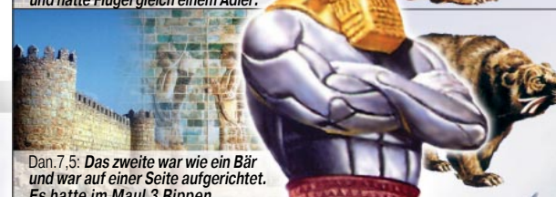
Dan. 7,5: Das zweite war wie ein Bär und war auf einer Seite aufgerichtet. Es hatte im Maul 3 Rippen.

Im Jahre 538 v.Chr. wurde das Doppelreich der Meder und Perser aufgerichtet. Die 3 Rippen stellen die eroberten Länder Lydien, Babylon und Ägypten dar. Die Perser waren mächtiger als die Meder und regierten auch länger (siehe einseitig aufgerichteter Bär).