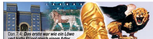
Dan. 7,4: Das erste war wie ein Löwe und hatte Flügel gleich einem Adler.

Der goldene Kopf und der Löwe (ein beliebtes Symbol Babylons) stellen das babylonische Weltreich (608-538 v.Chr.) dar. Die Adlerflügel kennzeichnen die schnellen Eroberungskriege unter Nebukadnezar.