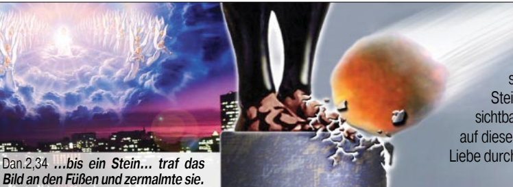
Dan.2,34 ...bis ein Stein... traf das Bild an den Füßen und zermalmte sie.

Haben wir unsere Sünden bekannt und sind wir entschlossen, mit Gott ein neues Leben zu beginnen, dann dürfen wir auch zu Ihm kommen und Ihn bitten, daß Er unsere Sünden tilgen und uns ein neues Herz schenken möge. " Wenn wir unsre Sünden bekennen, so ist er mir sündigt " (2.Mose 32,33). Bei allen, die aufrichtig ihre Sünden bereut und im Glauben Jesus Christus als ihren Erlöser angenommen haben (Johannes 1,12), wird Vergebung in die himmlischen Gerichtsbücher geschrieben. Sie vertrauten allein auf Jesus Gerechtigkeit, die ihnen durch den Glauben angerechnet wird (1.Johannes 2,28). Deshalb wird ihr Leben mit dem Gesetz Gottes in Übereinstimmung gefunden, alle ihre Sünden werden getilgt und sie selbst des ewigen Lebens für würdig erklärt. Denn so spricht Gott: " Ich, ja Ich tilge deine Übertretungen um meinetwillen und gedenke deiner Sünden nicht " (Jesaja 43,25). Solche werden an der Auferstehung der Gerechten teilnehmen, wenn alle " hervorgehen, die Gutes getan haben, zur Auferstehung des Lebens " (Johannes 5,29; 1.Thessalonicher 4,14-16).