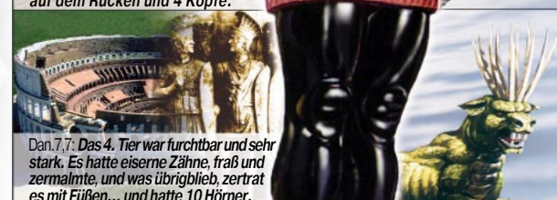
Dan. 7,7: Das 4. Tier war furchtbar und sehr stark. Es hatte eiserne Zähne, fraß und zermalmte, und was übrigblieb, zertrat es mit Füßen... und hatte 10 Hörner.

Im Jahre 168 v.Chr. gründeten die Römer das 4. Weltreich auf Erden. Wegen der Härte und Unduldsamkeit, mit der andere Völker unterworfen wurden, ging dieses Reich in die Geschichte als das "eiserne Rom" ein (siehe eiserne Beine des Standbildes und die Zähne des Tieres).