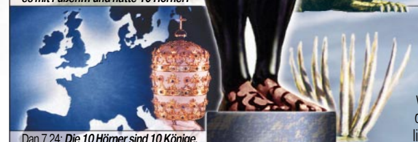
Dan. 7,24: Die 10 Hörner sind 10 Könige, die aus diesem Reich hervorgehen.

Durch die Völkerwanderung 351-476 n.Chr. zerfiel das römische Reich in 10 europäische Teilreiche (siehe die 10 Hörner und 10 Zehen). Die getrennt wachsenden Hörner und das nicht aneinanderhaften des Eisens und Tons der 10 Zehen, stellt die Unmöglichkeit der andauernden Vereinigung Europas dar.